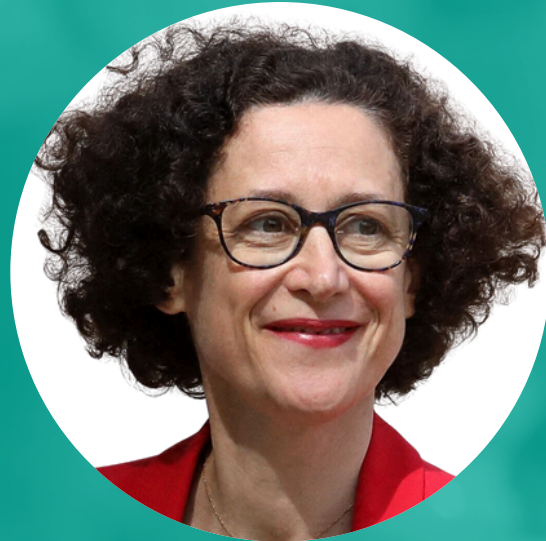
Emmanuelle Wargon Ancienne ministre et Présidente de la CRE